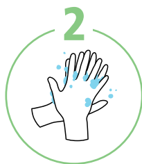
С обратной стороны ладоней