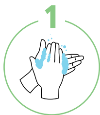
Ладонь к ладони