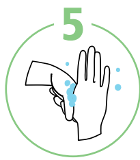
Большие пальцы рук