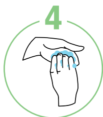
С обратной стороны пальцев